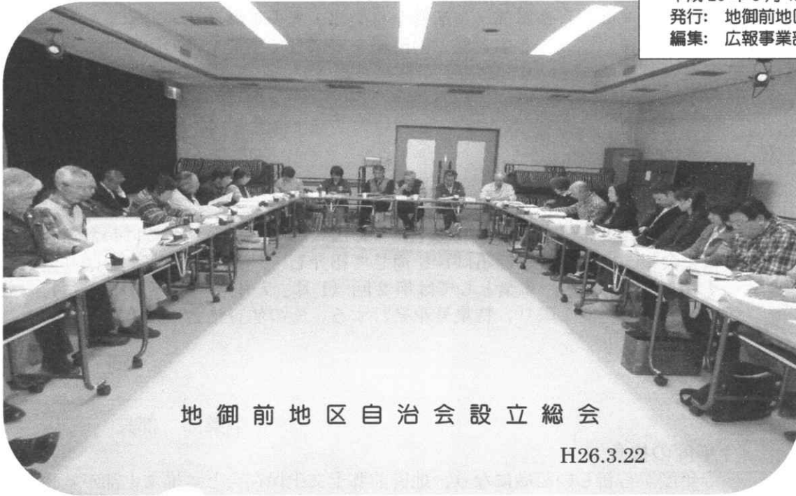
地御前地区自治会設立総会

地御前地区自治会 会報 設立 特集号 平成 26 年 5 月 15 日 発行: 地御前地区自治会 編集: 広報事業部