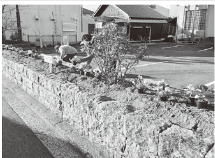
地御前市民センター植え替え