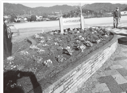
きらきら公園植え替え

今回は葉牡丹とビオラを計350株を植えました。こんな大変な時期ですが、また皆さんに喜んで頂き、元氣をお裾分け出来れば嬉しです♡